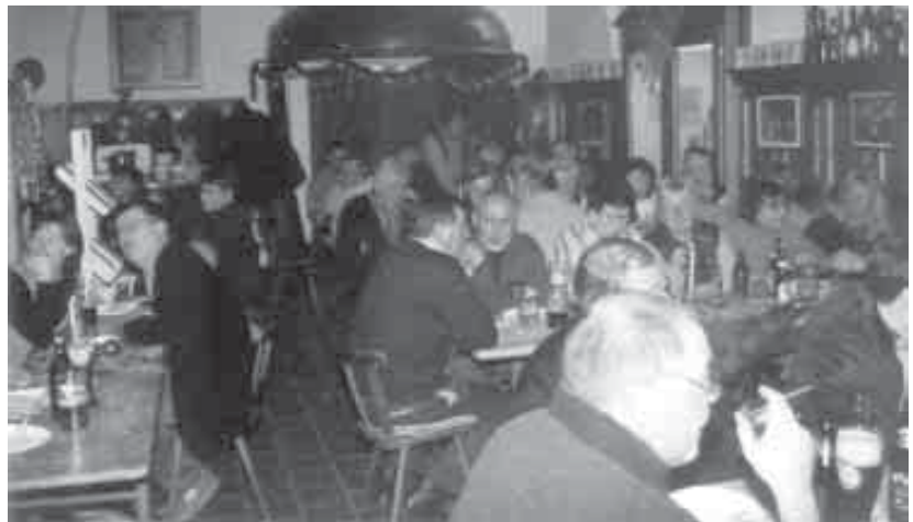
Wieder bis auf den letzten Platz besetzt war das FBM...