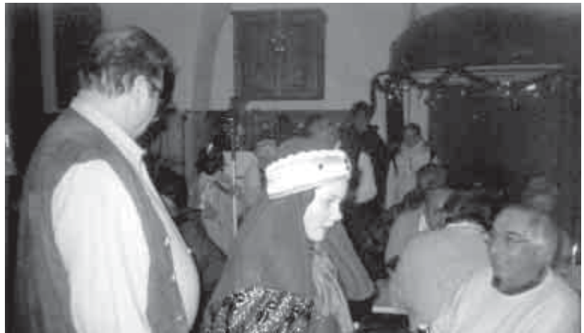
Auch die Heiligen Drei Könige waren dabei zu Gast.