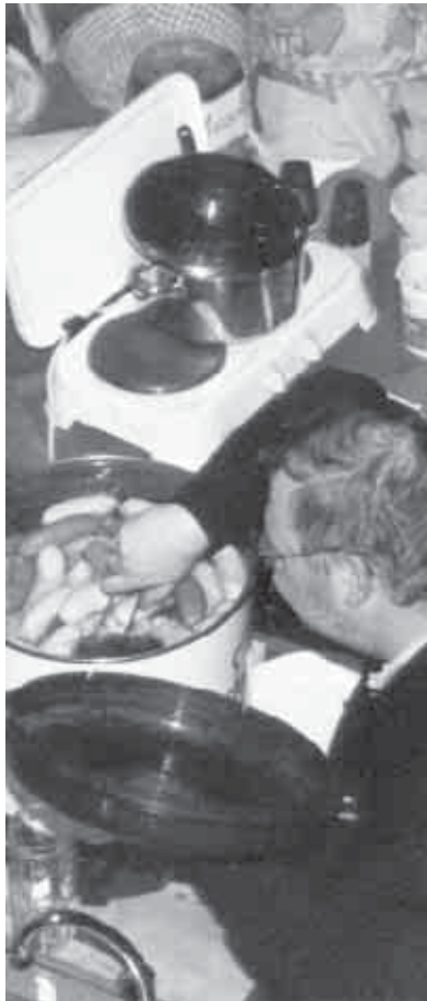
Zur Stärkung gab 's Würste...