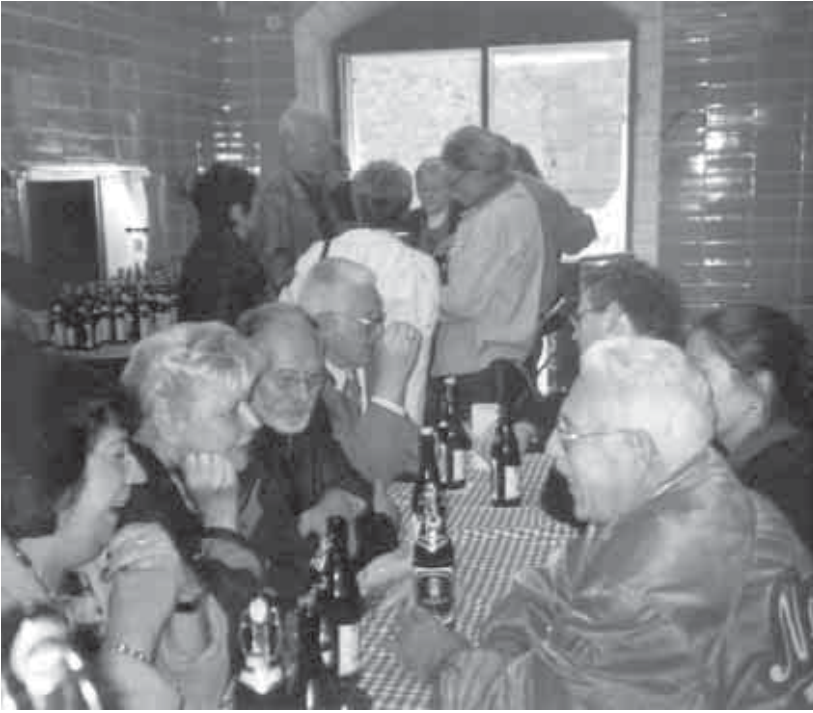
FBM-Mitglieder bei der geselligen Bierprobe in der Kronacher Kaiserhof-Brauerei.