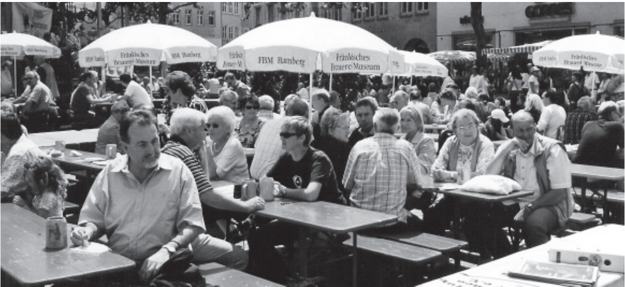
Wieder gut besucht: Das Nostalgiefest des FBM am Bamberger Gabelmann