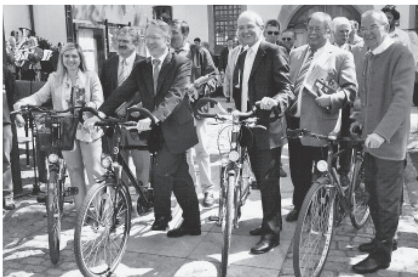
Die Prominenz eröffnete den neuen Rad- und Wanderweg