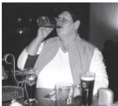
Auch den Frauen schmeckte das Bier...