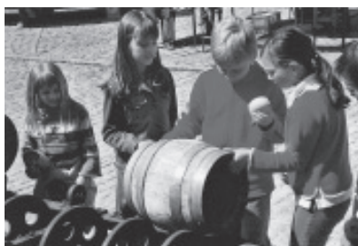
Was ein rechter Bierfan werden will...