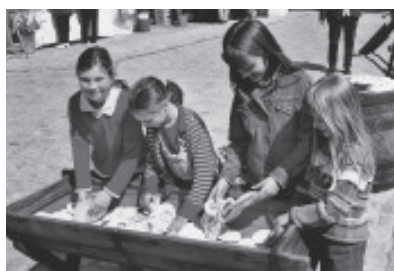
Mit Begeisterung wühlt man in den Bierdeckeln

„Unsere Bierecke“ nennen die beteiligten Brauereien liebevoll die Region am neuen Radweg im östlichen Steigerwald. 14 Brauereien sind auf 14 km Luftlinie vertreten – das ist einfach einmalig. Sie liegen in den vier Gemeinden Burgebrach, Schönbrunn, Lisberg und Priesendorf. Als dieses Ereignis kürzlich unter hoher Publikumsbeteiligung auf dem Schlossplatz Trabelsdorf gebührend gefeiert wurde, fehlte natürlich auch die Prominenz nicht: Neben den Bürgermeistern schnappten sich unter anderem auch Staats-