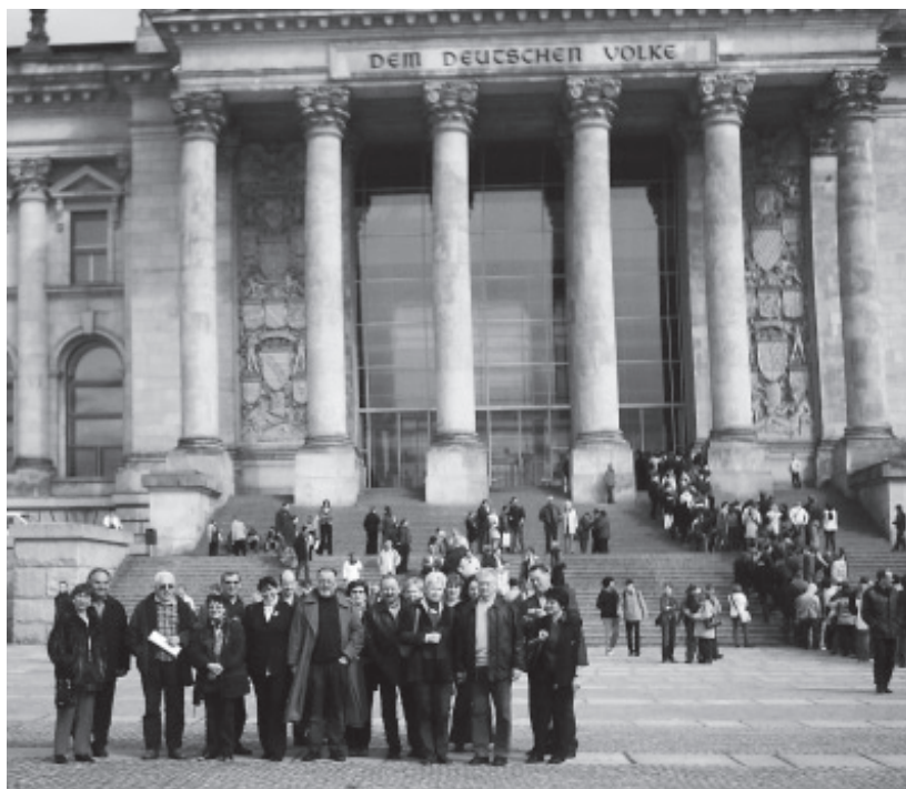
Ein Teil der Gruppe vor dem Berliner Reichstag

Zu den Highlights eines jeden Jahres, das sich das Fränkische Brauerei-Museum für seine Mitglieder und Freunde ausdenkt, gehören die Bier-Exkursionen. Zuletzt führte eine dreitägige Reise nach Berlin. Nach Ankunft in der Bundeshauptstadt besuchte man den Reichstag, ehe die Teilnehmer im Vier-Sterne-Hotel „Berlin“ Quartier bezogen. Tags darauf standen neben einer Stadtrundfahrt ein Bummel über den Ku´damm sowie ein Besuch des berühmten Kaufhauses KaDeWe auf dem Programm, der Nachmittag stand zur freien