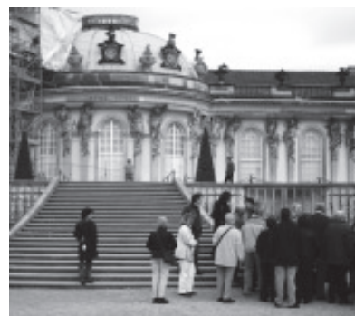
Willkommener Abstecher nach Potsdam...